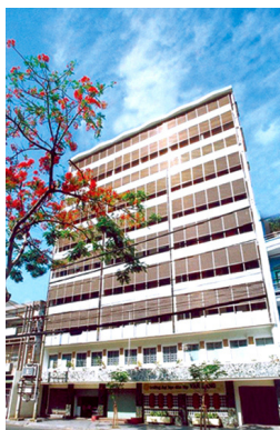
CƠ SỞ 1 45 Nguyễn Khắc Nhu, P. Cô Giang, Q. 1, Tp. Hồ Chí Minh